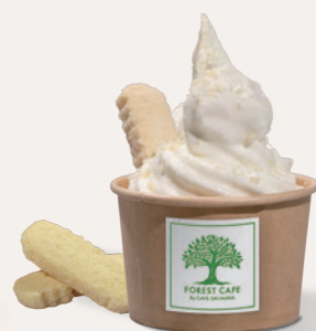
沖縄ちんすこう Okinawa Chinsukou ¥ 700