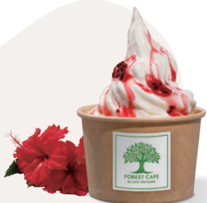
宮古島ハイビスカス Miyakojima Hibiscus ¥ 700