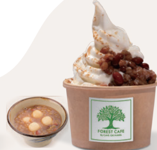
沖縄黒糖ぜんざい Brown Sugar ZENZAI ¥ 750