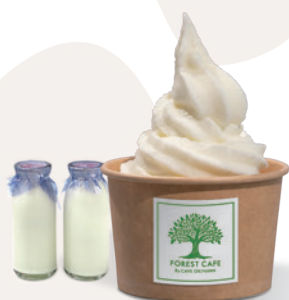
ミルク Milk ¥ 600

産地直送のフレッシュな沖縄県産牛乳を使用 他では味わえない濃厚でクリーミーな ソフトクリームです。