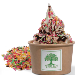
カラフルチョコレート Colorful Chocolate ¥ 700