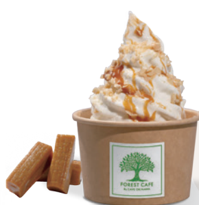
キャラメル&ナッツ Caramel & Nuts ¥ 700