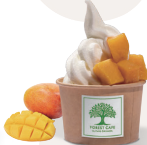
トロピカルマンゴー Tropical Mango ¥ 750