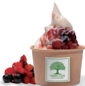
ダブルベリー Double Berry ¥ 750